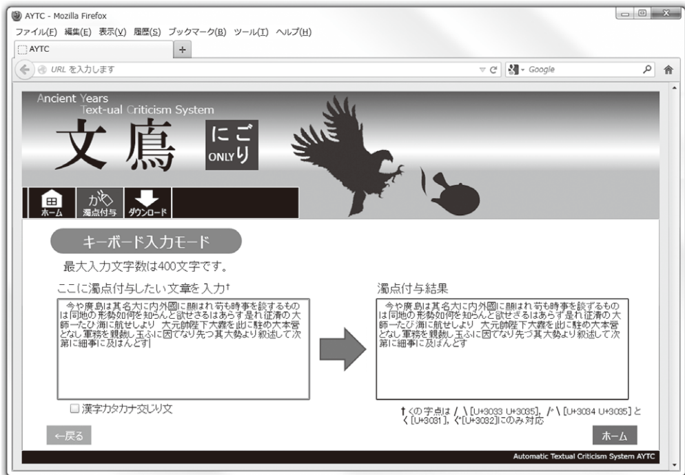
図 3 濁点自動付与アプリケーション AYTC

こうして開発された自動濁点付与プログラムは、文系研究者にも利用可能な使いやすいアプリケーション「AYTC」として公開している（図 3）。AYTC は Silverlight 7 アプリケーションとして開発されており、特定の OS やブラウザに依存せず、幅広い PC 環境で利用することが可能になっている（岡ほか 2012）。