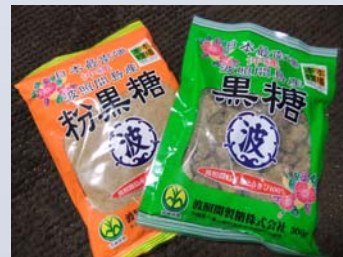
サトウキビから作られる黒糖は、「粉」と「粒」があります。