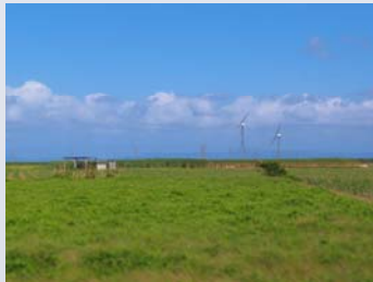
船からクルクルと気持ちよさそうに回る風力発電機が見えるとそろそろ到着です。