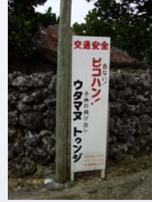
ピコハン!ウタマヌドゥンジ まるで呪文のようなことば。意味は「危ない!子どもの飛び出し」