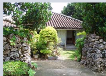
島には5つ集落があります。赤瓦の屋根とサンゴの石の石垣が特徴的です。