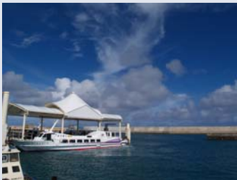
高速船に1時間揺られないとたどり着かない島。波が高いと欠航するので、運もないとたどり着けません。