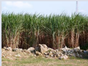
波照間島の主要な産業は、サトウキビ栽培・製糖と観光業です。