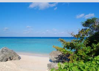
一度波照間島の海を見てしまったら、どこの海に行っても満足できなくなってしまう？！