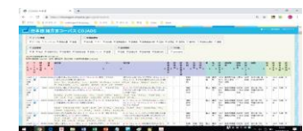
日本語諸方言コーパス(COJADS) https://chunagon.ninjal.ac.jp/cojads/search

宮崎県椎葉村, 愛知県木曾川町, 青森県むつ市, 八戸市などで, 地域の人たちと協力して, 方言の合同調査を行っています。全国の大学生・大学院生が公募により参加します。