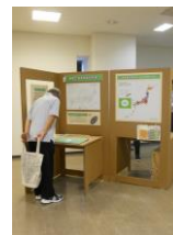
モバイル型展示ユニット

各地でモバイル型展示ユニットを使った展示を行っています。文化庁と協力して毎年「危機言語・方言サミット」を開催しています。