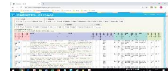
日本語諸方言コーパス(COJADS) https://chunagon.ninjal.ac.jp/cojads/search

宮崎県椎葉村、愛知県木曾川町、青森県むつ市、八戸市などで、地域の人たちと協力して、方言の合同調査を行っています。全国の大学生・大学院生が公募により参加します。