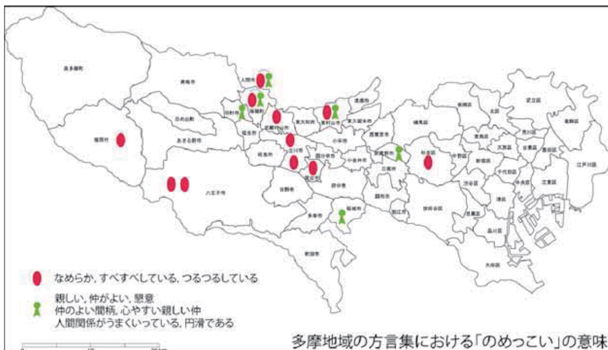
図3 多摩地域の方言集における「のめっこい」の意味 6

生育の80歳代の話者2名（2012年確認）もほぼ同様であった。一方立川市の60歳代の話者は、この語は上の世代が使うのを聞くといい、使うとすると「うどんの喉ごしがよい」ことにほぼ限られる、とした。〈接触感覚〉の意味から〈人間関係〉の意味が派生する一方で、この語自体の使用が衰退して意味も退縮し、その中で、〈接触感覚〉の中のさらに特定の状況へと意味の限定が生じていることがわかる。