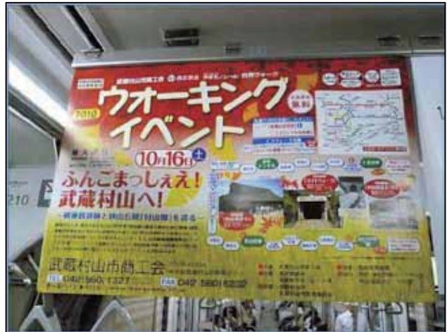
図2 ふんごまっしええ! 武蔵村山へ! (2010年9月, 多摩都市モノレール車内)