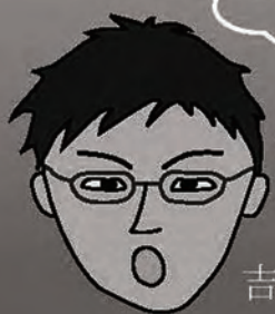
吉井のおんちゃん