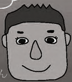
坂本のおんちゃん