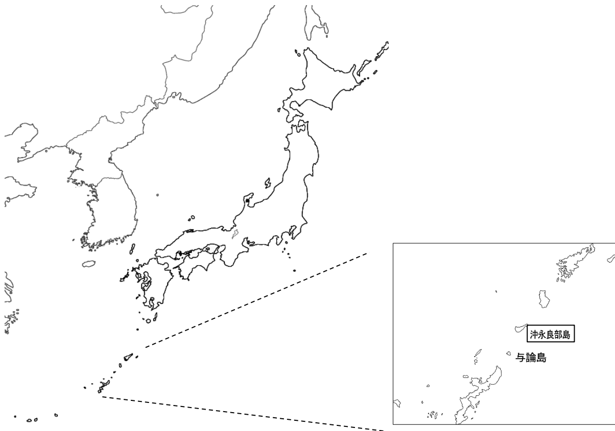
図 1 沖永良部島の位置

島への交通手段は、飛行機が鹿児島空港から 1 日 3 便、那覇空港から 1 日 2 便、奄美大島空港から 1 日 1 便、与論空港から 1 日 1 便運航している。フェリーは、鹿児島港から和泊港へ 1 日 1 便、那覇港から和泊港へ 1 日 1 便、鹿児島港から知名港へ月 9 便ほど運行している。