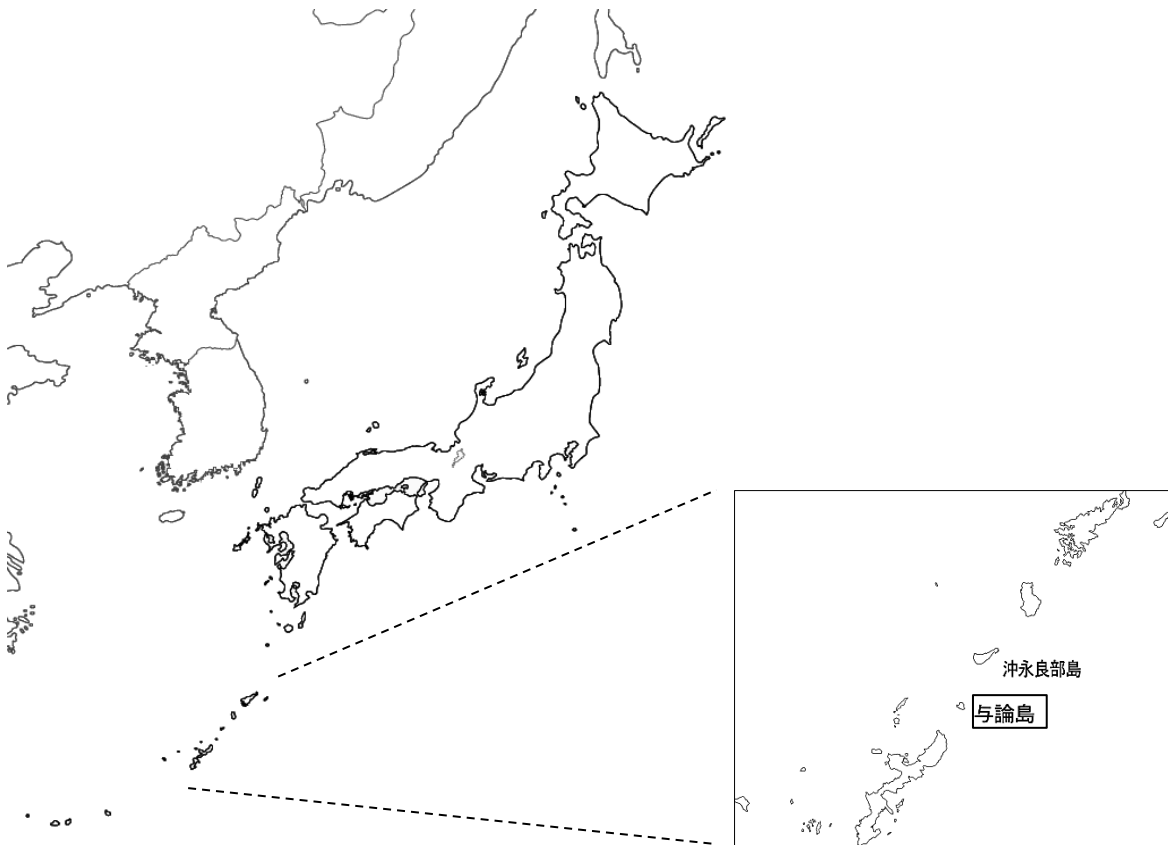
図 1 与論島の位置

島への交通手段は、飛行機で与論空港へ入る方法と、船で与論港へ渡る方法がある。飛行機は、鹿児島空港から 1 日 1 便、那覇空港から 1 日 1 便、奄美大島空港から 2～3 日に 1 便の運航があり、フェリーは鹿児島港から 1 日 1 便、那覇港から 1 日 1 便が運行している。