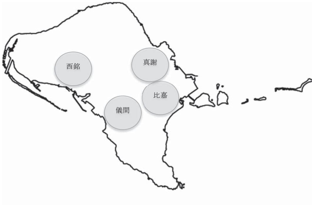
地図2 調査地点の位置