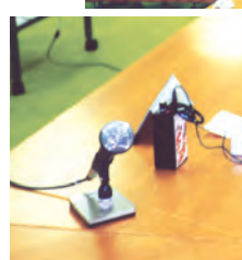
仮設の通訳者ブースと受信機