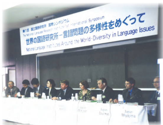
第1回国際シンポジウム（平成6年開催）