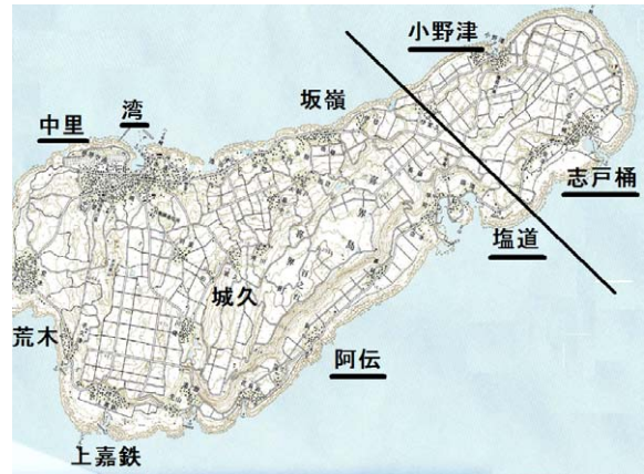
図2 調査地点と方言区画

母音の種類と発音のしかたも、北部と南部で大きく違っている。例えば、北部の小野津や志戸桶では、7種類の母音が使われているが、小野津、志戸桶以外の喜界島南部方言では、5種類の母音が使われている。奄美の他の地域に目を向けると、奄美大島、加計呂麻、徳之島では、喜界島北部と同じ7母音、沖永良部、与論では喜界島南部と同じ5母音が使われている。このように、喜界島は奄美諸方言の母音のバリエーションを一つの島のなかに持っていて、ちょうど奄美諸島の縮図のような様相を呈している。本稿ではこのような喜界島方言の母音の地域差を見ることにより、母音のバリエーションがどのようにして形成されたのかについて考えてみたい。