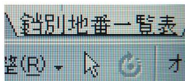
図 6 弟子屈町役場パソコン外字

ISO/IEC 10646 に追加収録されたからといって、追加された文字がすぐに実装されるわけではありません。しかし、国際規格として標準化されたことにより、パソコンや業務システムで標準的に扱え、情報交換ができるような環境の実現に、一歩近づいたと言えるでしょう。