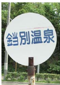
図 4 バス停留所

2008 年 9 月に弟子屈町を訪れた折、街路の表示には、「鎗」「鎗」の双方が使われているのを見ました(図 4, 図 5)。しかし、公式の字名表記は「鎗別」であるため、住民票や公図などの公文書では「鎗」を用いる必要が生じます。そのため役場では、パソコン用の外字(標準的に用意されている文字以外で、ユーザが特別に追加した文字)を作成して、日々の業務を行っています(図 6)。住民の転出などにより、弟子屈町以外の自治体と公文書を電子的にやりとりする場合に不便が生じると、困っている現状を役場の方ではうたえおられました。