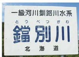
図 5 河川標示