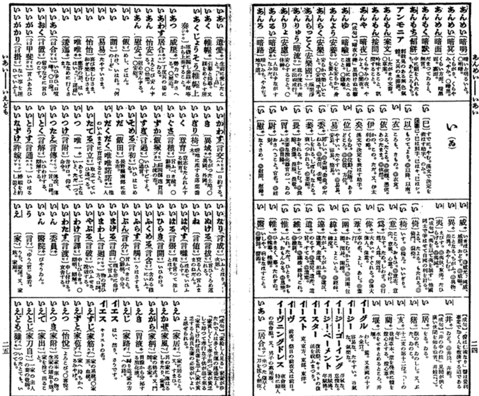
図1 『アクセント表示 新辞海』

三宅がアクセント記述を担当した吉沢義則編 (1938)『アクセント表示 新辞海』は、「五万五〇〇〇語 五十音順。通俗辞典としてはじめてアクセントを字の右に線を施して表示した (図1)。担