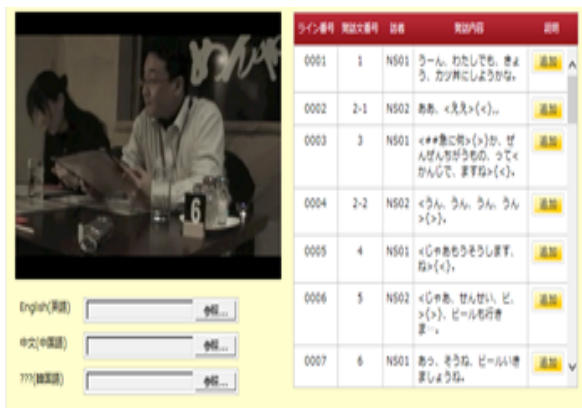
図4 動画と会話スクリプトの連動 (完成画面の一部)