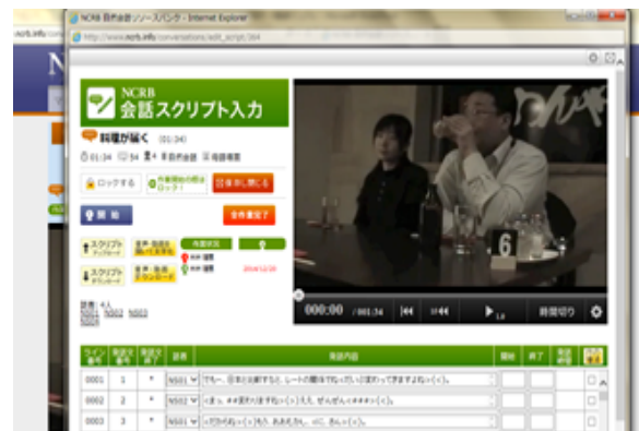
図2 会話スクリプト入力画面