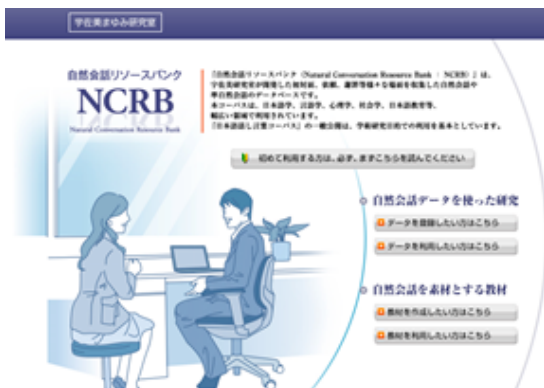
図1 NCRB トップページ

NCRB の利用環境は、OS : Windows7, 8、ブラウザ : Internet Explorer9~11, Google Chrome で、登録可能なデータの形式は、mp4 (動画)、mp3 (音声) ファイルである。構成は、大きく、「自然会話データを使った研究」と「自然会話を素材とする教材」の2つに分かれている。それぞれ、「登録や作成」と「利用のみ」で入り口が分かれており、「自然会話を使った研究」は、「データを登録したい方はこちら」及び「データを利用したい方はこちら」、また、「自然会話を素材とする教材」は、「教材を作成したい方はこちら」及び「教材を利用したい方はこちら」と、全体として4つの入り口がある。会話の登録と教材の作成には、アクセス用の ID とパスワードが必要である。会話データ (音声・会話スクリプト、それらに関する情報) は、NCRB トップページ (図1) より、「自然会話データを使った研究」の「データを登録したい方はこちら」から登録する。作業の流れは、「音声・動画のアップロード」→「音声・動画情報の入力」→「話者情報の入力」→「会話情報の入力」→「会話スクリプトの入力」となる。各作業は「音声・動画」、「会話」、「会話グループ」という3つの画面で行い、上部のタブを切り替えることで画面を移動できる。会話スクリプトはNCRB 上でも、動画や音声を聞きながら作成していくこともできるが (図2)、「BTSJ システムセット」を用いて文字化資料を整えた後、NCRB にアップロードすることもできる (研究には、文字化入力支援機能が多く自動集計もできる後者を推奨する)。また、会話スクリプト画面では動画や音声にタイムスタンプを押すことができ、文字化や分析の際に動画や音声の頭出し再生がしやすくなっている。