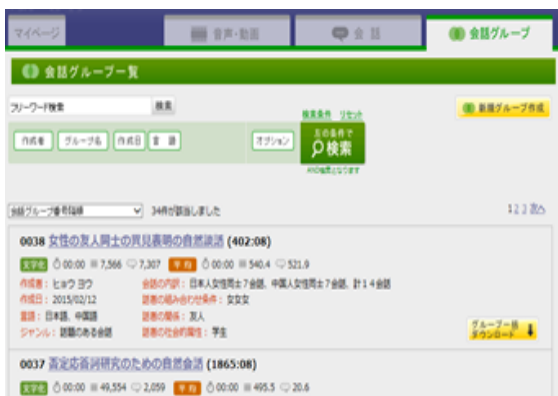
図3 会話グループ画面