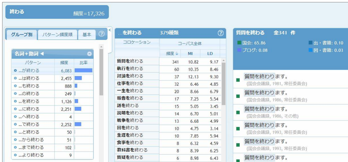
図3 NLBの画面「終わる」の例

なお、上で紹介したコーパスやツールの多くは国立国語研究所のコーパス開発センターのサイトから情報を得ることができる。」