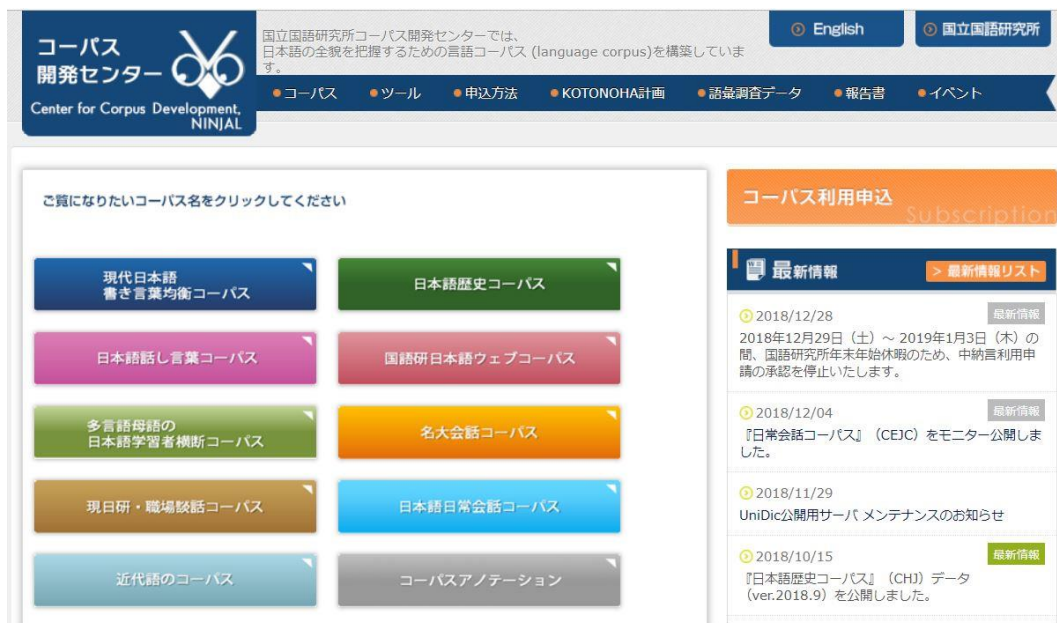
図4 コーパス開発センターのサイト

なお、上で紹介したコーパスやツールの多くは国立国語研究所のコーパス開発センターのサイトから情報を得ることができる。」