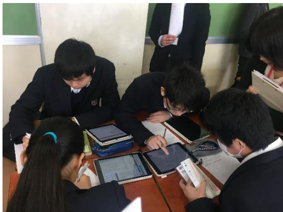
写真1 タブレット端末を利用した調べ学習

教科書や単語帳で当たりを付け、検索にはタブレット端末を用い、紙のワークシートに記録するという、新旧の学習材を並行利用した学習活動で、ICT機器の導入において現在もっとも抵抗が少ない授業形態であると言える。また、教育効果も期待でき、赤堀(2015)では複数の異なるメディアを並行利用することによって学習効果も高まると指摘している。