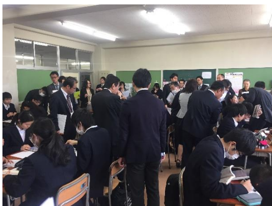
写真5 参観者で賑わう授業(第2時)

本研究のような外部の研究者が協力して実践された ICT を活用する国語科の授業は、ICT を活用した授業を多数実施している金沢高校(現在文科省から研究指定校の認定を受けている)においても新しい試みであった。そのため多くの参観者を迎えることができた。日頃から各教科で ICT を活用した授業に取り組んでいる教師らにとっても ICT を活用した国語科の授業は関心の高いものであることが伺える。