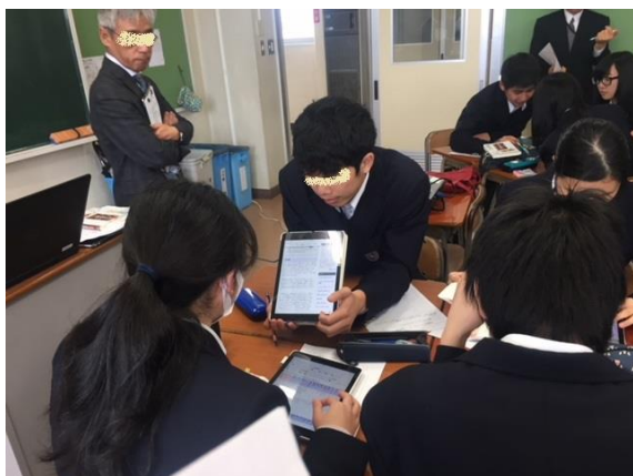
写真3 タブレット端末での交流

タブレット端末を利用した経験を持つ学習者であったので、比較的容易にメディアの使い分けを行えたのではないかと推察する。