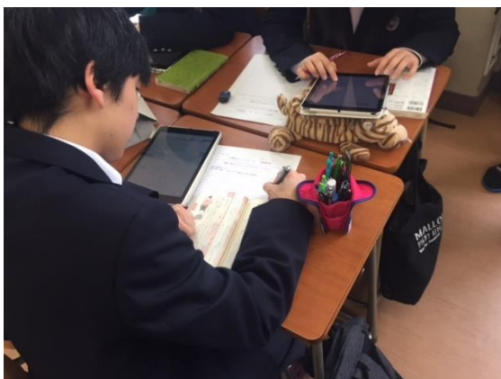
写真2 タブレット端末とワークシートの並行利用

教科書や単語帳で当たりを付け、検索にはタブレット端末を用い、紙のワークシートに記録するという、新旧の学習材を並行利用した学習活動で、ICT機器の導入において現在もっとも抵抗が少ない授業形態であると言える。また、教育効果も期待でき、赤堀(2015)では複数の異なるメディアを並行利用することによって学習効果も高まると指摘している。