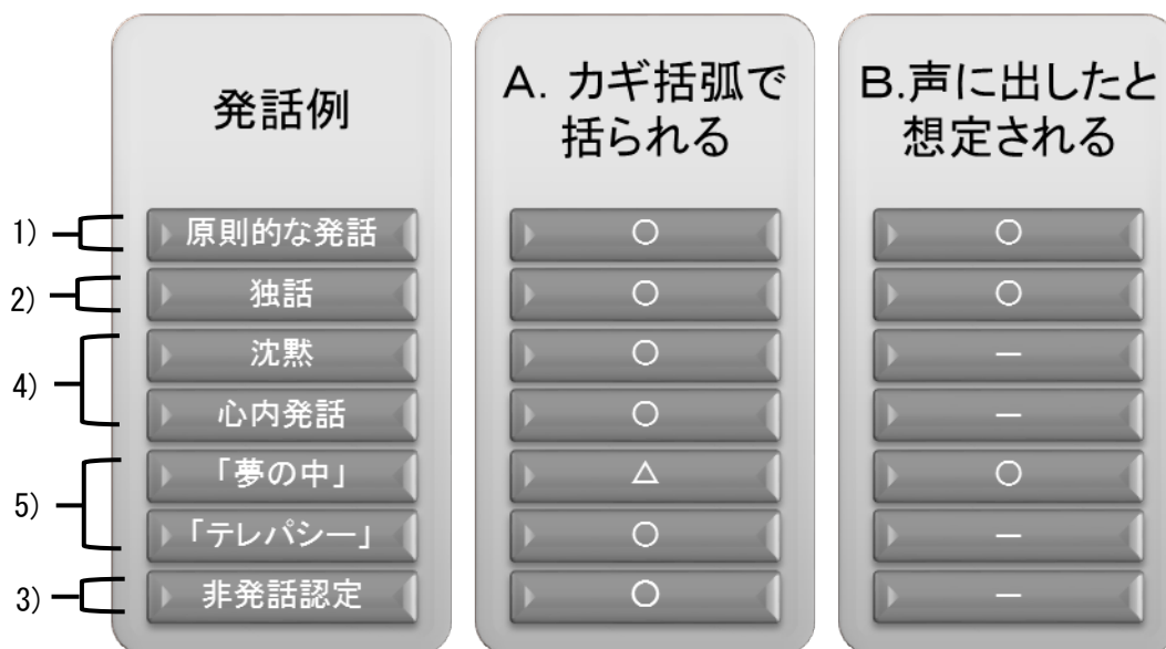
図2 本稿で抽出した発話形態

以上、本稿ではじめに示した発話箇所認定の基本基準1)～5)と、具体的な発話例を照らし合わせると、図2のように示すことができる。発話はAとBの両方の条件を備えているものが原則であるが、小説・物語という書き言葉媒体と作家の個性ともいべき文体のあり方を考慮した上で、AもしくはBの条件を備えているものを提示した。